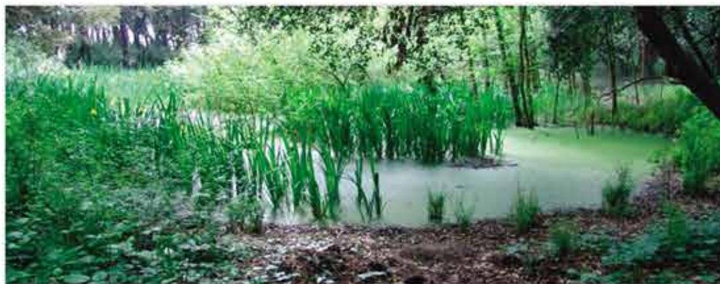
Laghetto all'interno della Riserva

Percorrendo il territorio della Riserva è possibile osservare, in prossimità del mare, le comunità psammofile tipiche delle dune embrionali alle quali seguono le rigogliose comunità arbustive della macchia mediterranea, a tratti interrotte da splendidi pratelli erbacei ricchi di orchidee e, più internamente, le boscaglie a leccio, le pinete a Pinus pinea ed il nucleo di vegetazione igrofila retrodunale. La flora è molto ricca, con oltre 300 specie finora censite alle quali appartengono entità di rilevante importanza fitogeografica come Daphne sericea , specie arbustiva mediterraneo montana piuttosto rara in Italia e la Santolina delle spiagge Otanthus maritimus : pianta perenne suffruticosa e ricoperta da una fitta tomentosità (peluria) biancastra. La diversità di habitat della Riserva favorisce la presenza di una ricca fauna e, tra le specie di particolare importanza, si ritrovano la testuggine ( Testudo hermanni ), il riccio ( Erinaceus europaeus ), la volpe ( Vulpes vulpes ) e, tra gli uccelli, la cinciallegra ( Parus major ), il merlo ( Turdus merula ) e numerose specie migratorie.