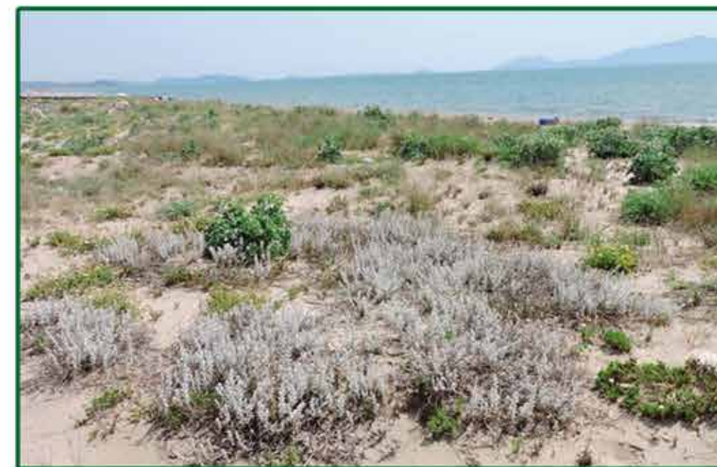
Santolina delle spiagge