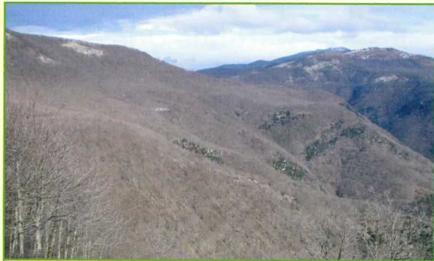
Veduta della Riserva

La Riserva Naturale Orientata "Valle delle Ferriere" ha una superficie di Ha 450 all'interno del Comune di Scala (SA) e va da un'altitudine di 300 ad un massimo di 1203 m s.l.m. (Monte Cervigliano).