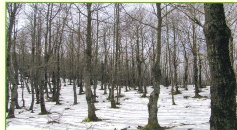
Riserva in veste invernale