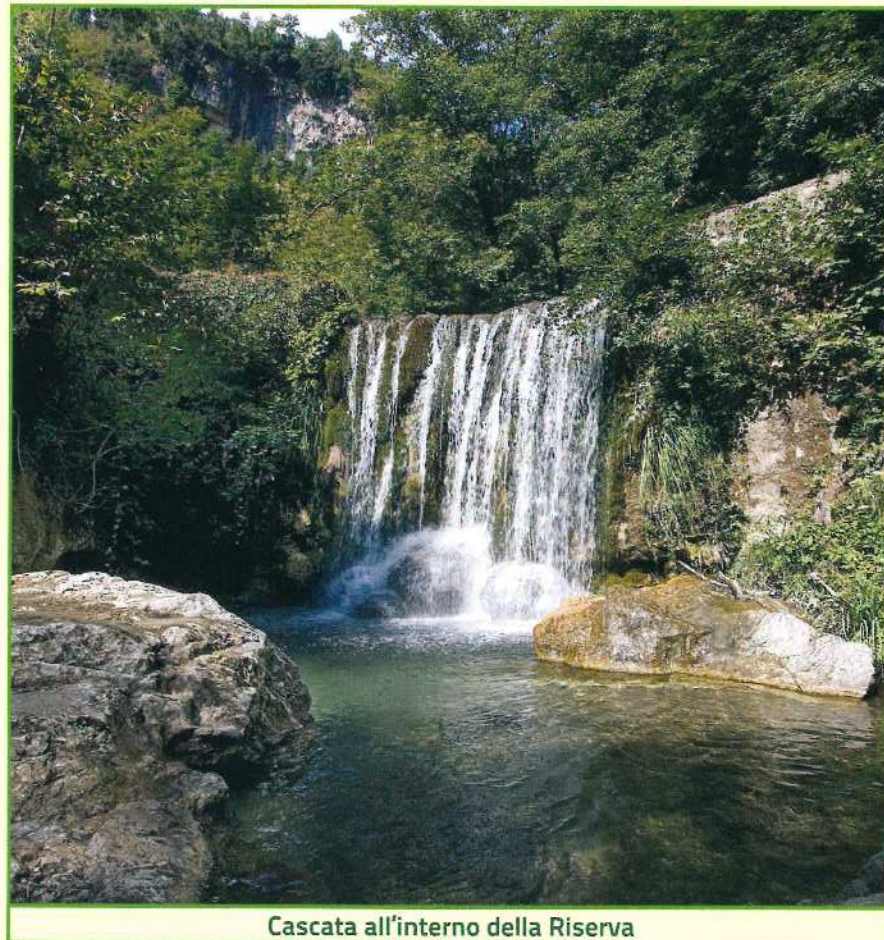
Cascata all'interno della Riserva

Vista la straordinaria ricchezza di biodiversità, l'intera area è stata tutelata con l'istituzione della "Riserva Naturale Orientata" avvenuta con D.M. 29/03/1972.